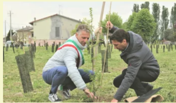
Forestazione urbana: piantati duemila nuovi alberi in provincia di Modena In "Ma lo sai che"