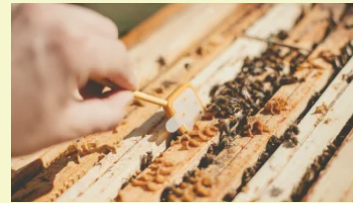
Box 3Bee: il primo cofanetto sostenibile per proteggere le api e sostenere gli apicoltori In "Ma lo sai che"