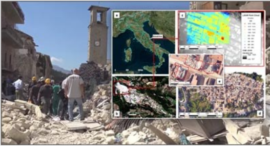
Terremoto: satelliti, sensori e algoritmi per la ricostruzione p