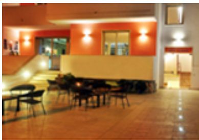
Hotel La Punta *** Otranto (Le) ... a 50 m. dal mare

L'abbattitore biologico Odorless, invece, utilizza microrganismi innocui, non patogeni per offrire una soluzione agli odori prodotti dalla raccolta differenziata con il caldo eccessivo. Tra i suoi punti di forza, c'è la degradazione delle emissioni odorigene con processo naturale e la sua ottima distribuzione per via dei tensioattivi che aiutano ad emulsionare i grassi facilitando il dissolvimento ad opera dei microrganismi. Un altro prodotto per una raccolta differenziata senza odori è Dirtless, liquido biologico per il lavaggio dei cassonetti. L'effetto pulente primario di questo prodotto è basato sull'utilizzo di una miscela di tensioattivi biodegradabili che aiutano l'emulsione e la mobilità delle sostanze organiche. Le colture microbiche di questo formulato sono particolarmente efficaci nella digestione delle sostanze organiche trattenute nelle fughe nelle crepe e nelle porosità delle superfici. L'effetto dei microrganismi arriva fino alla degradazione totale dei residui organici eliminando gli odori. Pertanto Dirtless è biologico e naturale e non deve essere utilizzato con nessun altro prodotto come candeggina, prodotti alcalini e/o acidi, detergenti e biocidi.